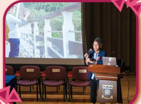
嘉賓在台上與學生分享學習心得