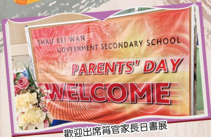
歡迎出席筭官家長日書展