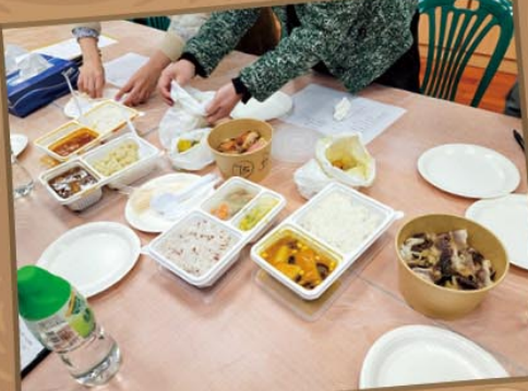
校方準備了當天的午餐飯盒及小食供家長們試食