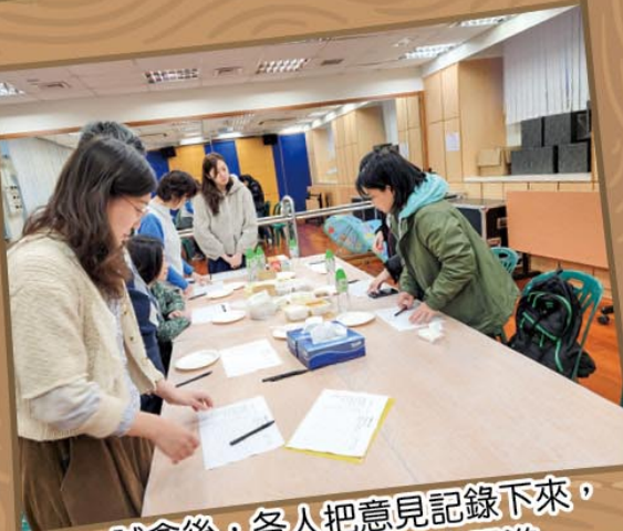
試食後，各人把意見記錄下來，以便向供應商提出跟進