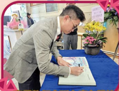
家長教師會副主席在學校名冊上簽名留念