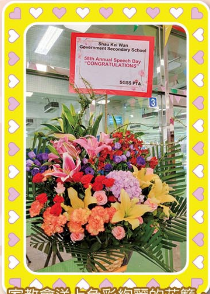
家教會送上色彩絢麗的花籃，祝願各得獎學生成績更進一步