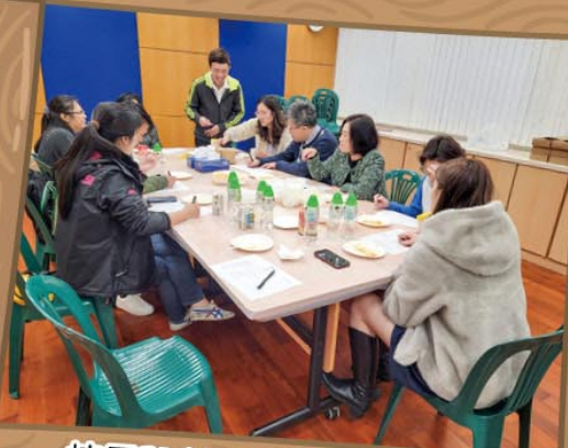
校長與老師及家長們認真地品嚐每款飯盒和小食