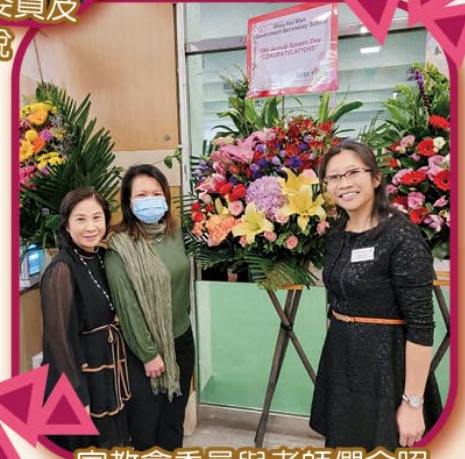
家教會委員與老師們合照