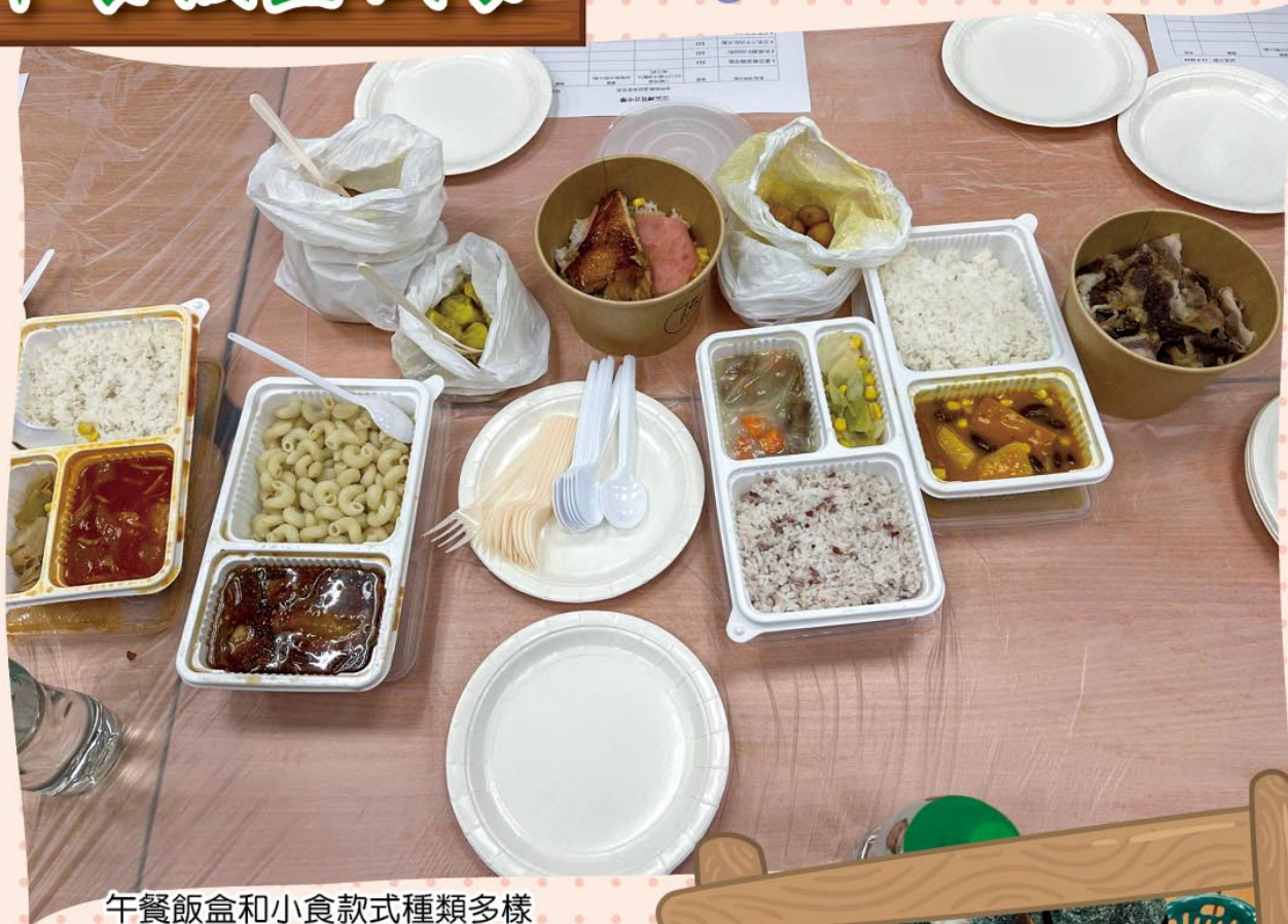
午餐飯盒和小食款式種類多樣