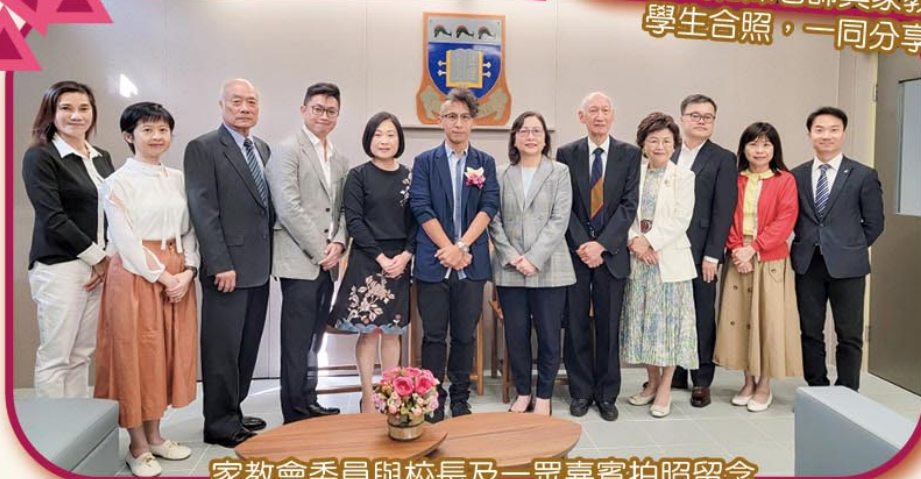
家教會委員與校長及一眾嘉賓拍照留念