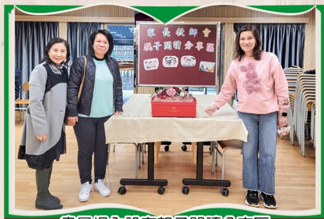
書展場內設有親子閱讀分享區