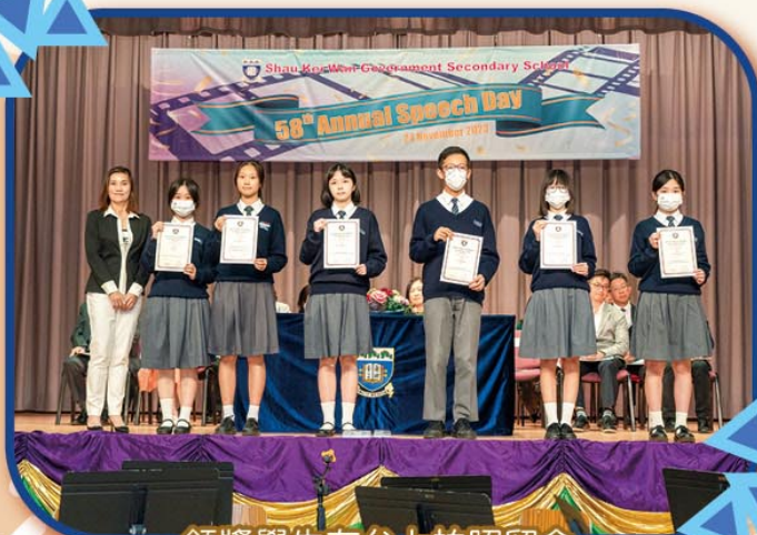
領獎學生在台上拍照留念