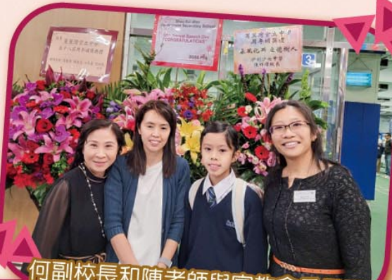
何副校長和陳老師與家教會委員及學生合照，一同分享喜悅