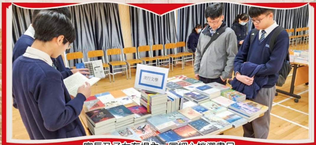
家長及子女在場內一同細心挑選書目