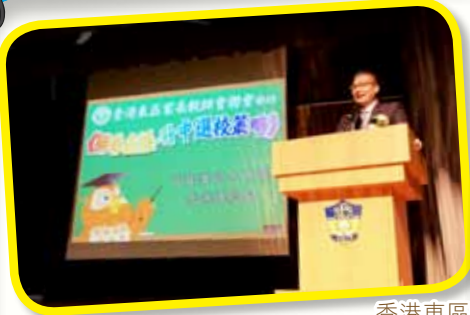
香港東區家長教師聯會主辦的升中講座 本校校長更是其中一位主講嘉賓 本會委員也很熱心地幫忙做義工