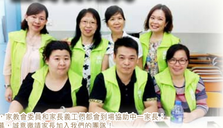
每年中一註冊當日，家教會委員和家長義工們都會到場協助中一家長；並於當天進行大招募，誠意邀請家長加入我們的團隊！