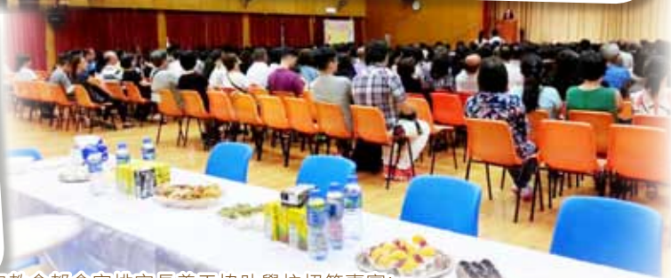
每年學校的畢業典禮，家教會都會安排家長義工協助學校招待嘉賓！