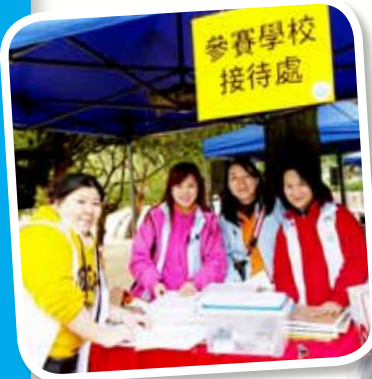
香港東區家長教師聯會 主辦的堆沙比賽