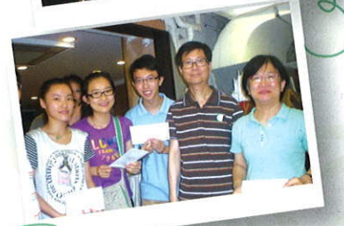
親子旅行得獎幸運兒